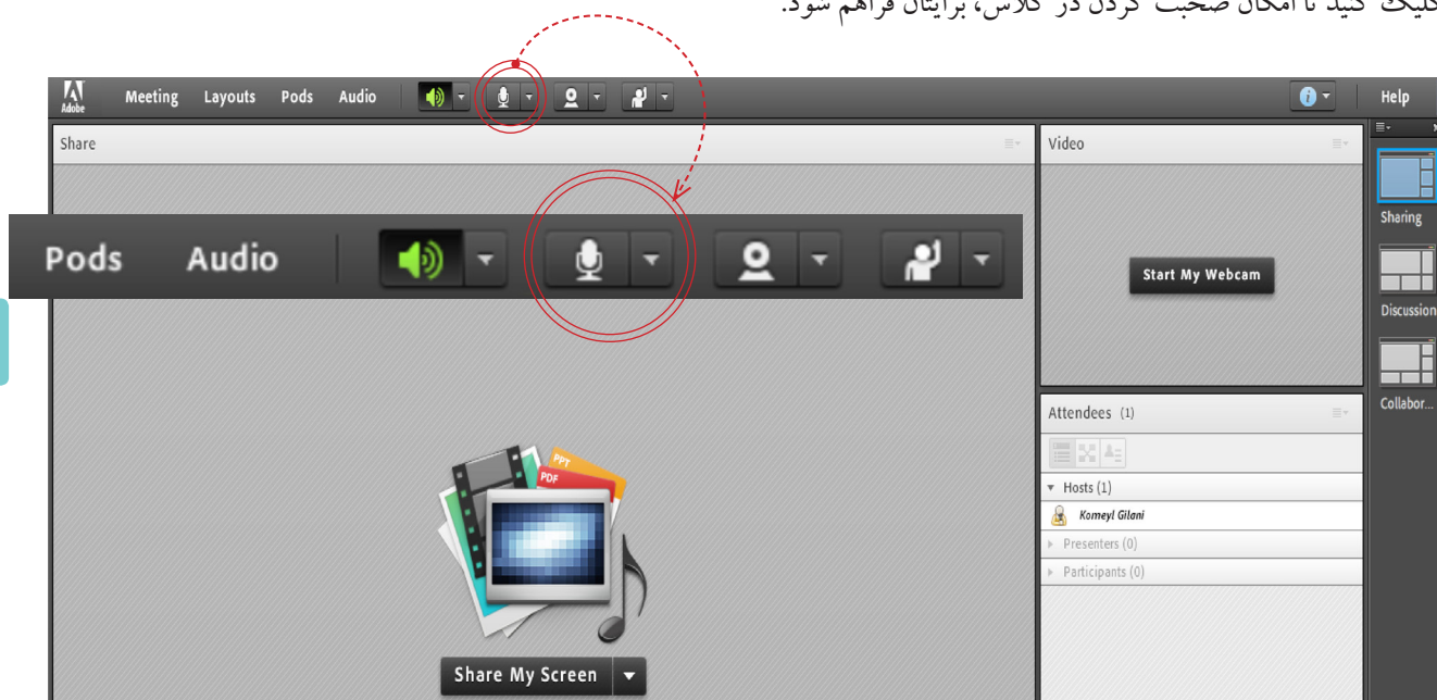
تصویر شماره ۳ - فعال سازی میکروفن

پس از چک کردن تنظیمات مربوط به صدا (راهنمایی بیشتر در صفحه ۱۰ تا ۱۲)، روی علامت میکروفن در قسمت میانی بالای صفحه کلیک کنید تا امکان صحبت کردن در کلاس، برایتان فراهم شود.