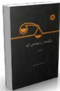
رنگینه ها و واسطه های آنها ویراست دوم تألیف آبراهارت ترجمه محسن حاجی شریفی چاپ اول ۱۳۶۹ صفحه ۳۱۲