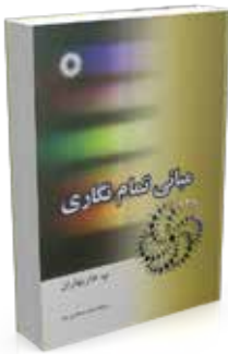
مبانی تمام‌نگاری تألیف پ. هاریهاران ترجمه داود صالحی‌نیا چاپ اول ۱۳۸۸ صفحه ۲۰۰