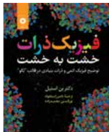
فیزیک ذرات خشت به خشت توضیح فیزیک اتمی و ذرات بنیادی در قالب "لگو" تألیف دکتر بن استیل ترجمه ناصر راستخواه، نورالدین محمدزاده چاپ اول ۱۳۹۹