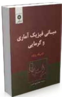
مبانی فیزیک آماری و گرمایی تألیف فردریک راف ترجمه عبدالرحیم اشعری چاپ اول ۱۳۸۸ چاپ سوم ۱۳۹۵ صفحه ۸۳۲