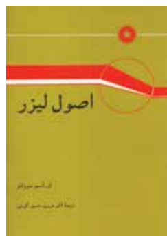
اصول لیزر ویراست چهارم تألیف اوراسیو سوولتو ترجمه اکبر حریری چاپ دوم ۱۳۹۳ چاپ سوم ۱۳۹۴ صفحه ۸۰۸