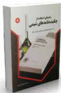
راهنمای استفاده از چکیده نامه های شیمی اداره چکیده نامه های شیمی، انجمن شیمی آمریکا ترجمه مسعود حسن پور چاپ اول ۱۳۷۵ صفحه ۳۵۲