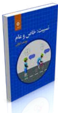
نسبیت: خاص و عام تألیف یوسف ثبوتی چاپ اول ۱۳۹۷ صفحه ۲۰۶