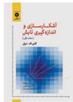
آشکارسازی و اندازه‌گیری تابش جلد اول تألیف گلن اف. نول ترجمه ناصر و ثوقی، سیدمهرداد زمزمیان چاپ اول ۱۳۹۸ صفحه ۵۶۰