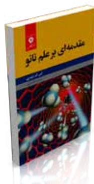
مقدمه‌ای بر علم نانو تألیف اس. ام. لیندزی ترجمه ف. اختر رجبی چاپ اول ۱۳۹۷ صفحه ۵۷۲