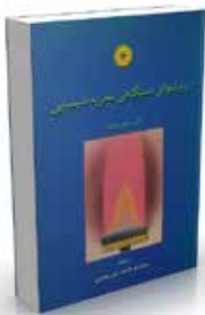
روشهای دستگاهی تجزیه شیمیایی تألیف گالن دبلیو. یوئینگ ترجمه عبدالرضا سلاجقه، علی معصومی چاپ اول ۱۳۸۱ صفحه ۶۲۴