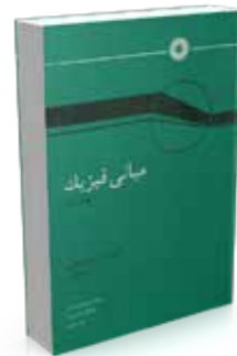
مبانی فیزیک جلد اول تألیف ب.م. یاورسکی، ا.ا. پینسکی ترجمه محمدتقی توسلی، مهرانگیز طالب‌زاده، ناصر مقبلی چاپ اول ۱۳۶۴ چاپ دوم ۱۳۷۶ صفحه ۶۷۶