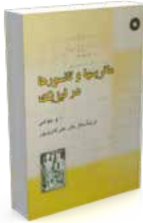
ماتریسها و تانسورها در فیزیک تألیف ای. دبلیو. جوشی ترجمه سالار باهر، علی ثامری‌پور چاپ اول ۱۳۸۴ چاپ سوم ۱۳۹۴ صفحه ۴۴۸