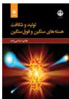
تولید و شکافت هسته‌های سنگین و فوق سنگین تألیف هادی اسلامی زاده چاپ اول ۱۳۹۹