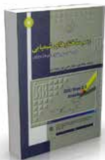
ساختارهای شیمیایی (راهنمای نرم افزار ISIS /Draw) تألیف وحید حائری، علی پورجوادی چاپ اول ۱۳۸۶ صفحه ۳۵۲