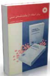
روش استفاده از چکیده نامه های شیمی گروه فنون آموزشی، انجمن سلطنتی شیمی (لندن) ترجمه مسعود حسن پور چاپ اول ۱۳۷۰ صفحه ۶۴