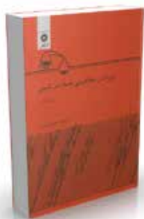
رزونانس مغناطیسی هسته در شیمی تألیف ویلیام کمپ ترجمه عیسی باوری چاپ اول ۱۳۶۹ چاپ دوم ۱۳۸۹ صفحه ۲۴۸