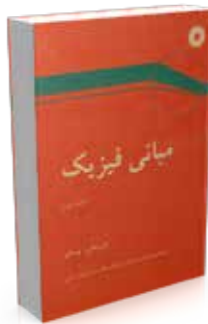
مبانی فیزیک جلد دوم تألیف یاورسکی، پینسکی ترجمه محمدتقی توسلی، مهرانگیز طالب‌زاده، ناصر مقبلی چاپ اول ۱۳۷۶ صفحه ۵۳۲